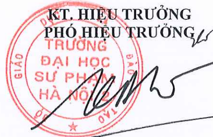
Cao Bá Cường